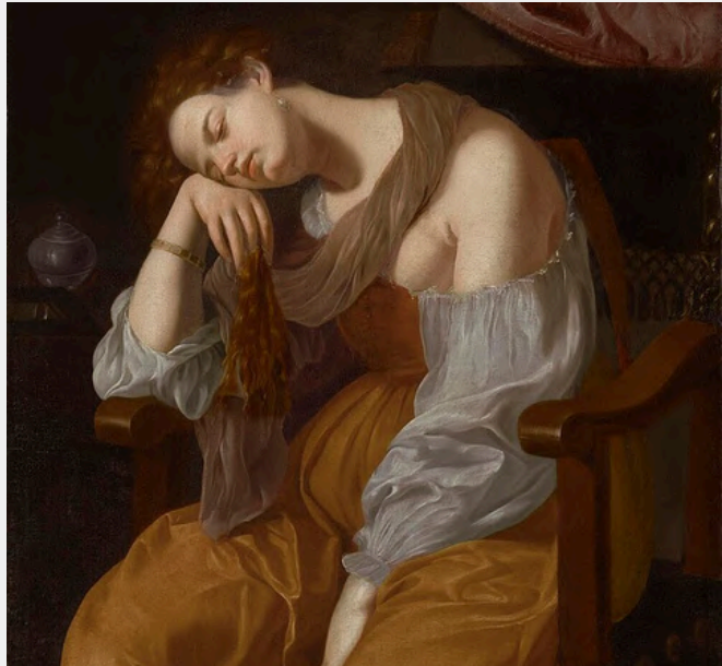
Figure emblématique de la peinture caravagesque, Artemisia Gentileschi est l'une des artistes les plus reconnues de son époque.