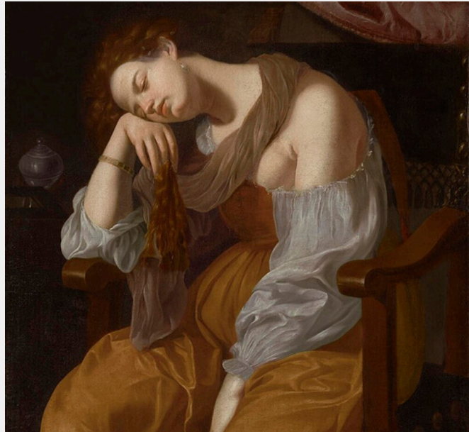
Figure emblématique de la peinture caravagesque, Artemisia Gentileschi est l'une des artistes les plus reconnues de son époque.